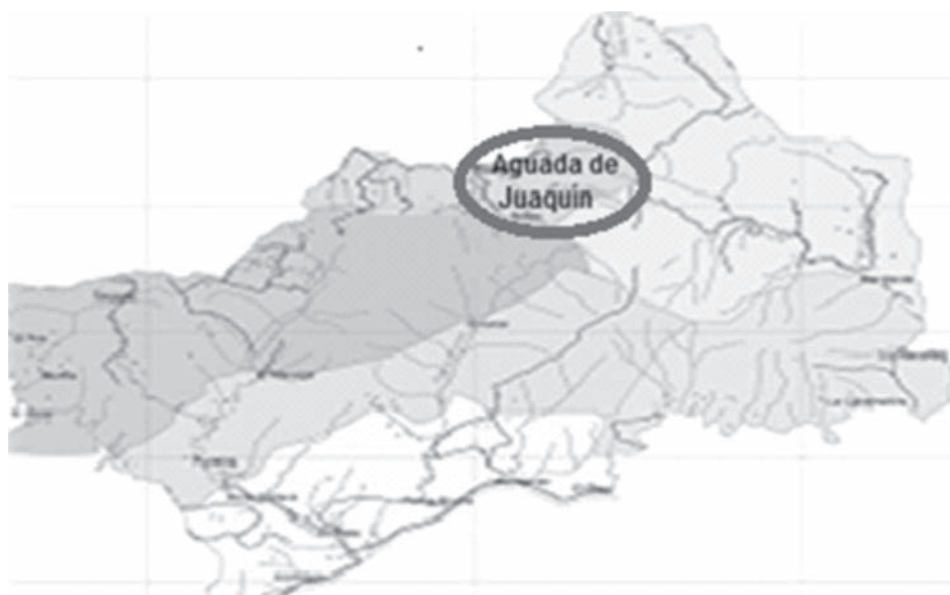
Ubicación geográfica del área de estudio.

La investigación se realizó en 2018 en el Parque Nacional Turquino (PNT) con presencia de Juniperus saxicola , ubicada en la Unidad Zonal de Conservación (UZC) Aguada de Joaquín (Fig.) sobre los suelos Ferralítico Rojo Lixiviado y Ferralítico Rojo Amarillento, localizado entre los 1000 y 1400 msnm (Lastres et al. , 2011).